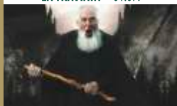
JOACHIM WITT · 09.07.