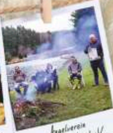
Angelverein Falkenstein Land e.V.