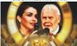
WEBER & EMMERLICH · 02.07.