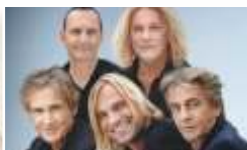
MÜNCHENER FREIHEIT · 04.06.