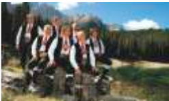
KASTELRUTHER SPATZEN · 26.08.