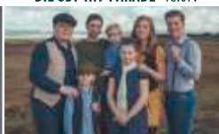
ANGELO KELLY & FAMILY · 31.07.