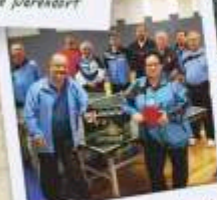
TTV 79 Tirpersdorf e.V.