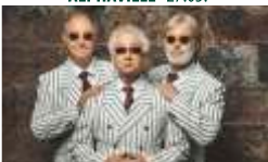
DAS ZWINGER TRIO · 09.06.