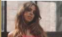
VANESSA MAI · 13.08.