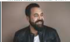
LAITH AL-DEEN · 12.08.