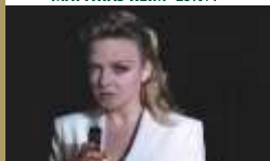
ANNETT LOUISAN · 05.08.