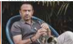
TILL BRÖNNER · 10.09.

INFOS & TICKETS: + 49 (0) 3 74 37 / 53 900 · www.naturtheater-badelster.de