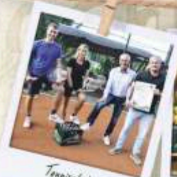
Tennisclub Triebes e.V.