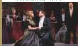
»LA TRAVIATA« · 01.07.