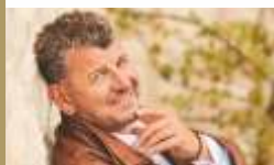
SEMINO ROSSI · 21.05.