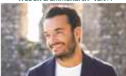
GIOVANNI ZARRELLA · 15.07.