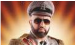
SERDAR SOMUNCU · 03.09.