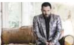
ALPHAVILLE · 27.05.