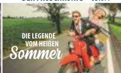
DIE OST-HIT-PARADE · 16.07.