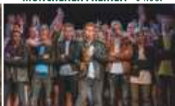
BEST-OF-MUSICALGALA · 11.06.