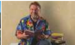
JÜRGEN VON DER LIPPE · 27.08.