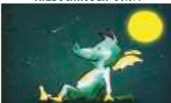
TABALUGA-MUSICAL · 07.08.